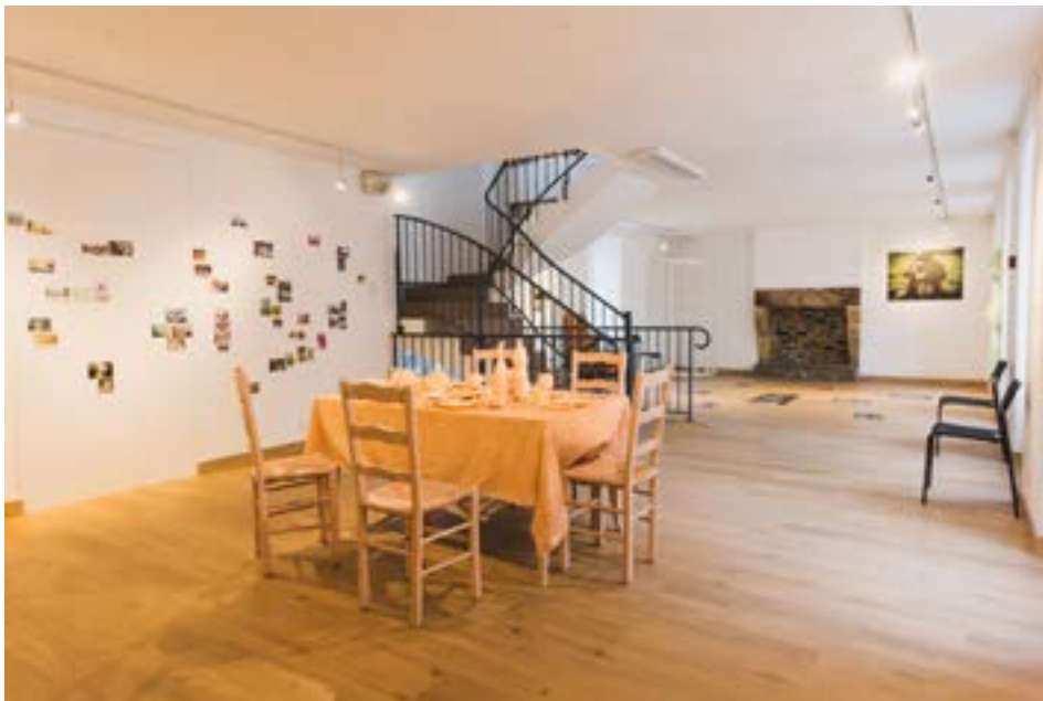
Niveau 1 de l'exposition à la Maison de la Fontaine, Brest, Avril 2020

De ces rencontres elles ont tout d'abord créé des installations plastiques pensées pour la maison de la Fontaine. Puis ces installations sont devenues des séquences de jeu dans le spectacle.